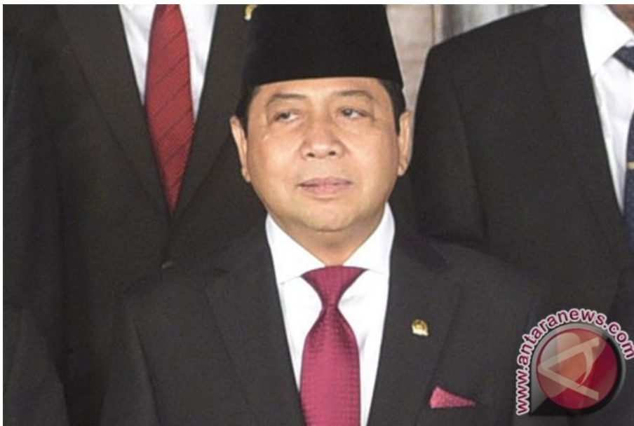
Ketua DPR Setya Novanto

“ Di forum-forum parlemen internasional, DPR RI dan Parlemen timor Leste juga perlu memperkuat kerja sama. Kita akan undang Parlemen Timor Leste pada konferensi ke-6 GOPAC,” ”