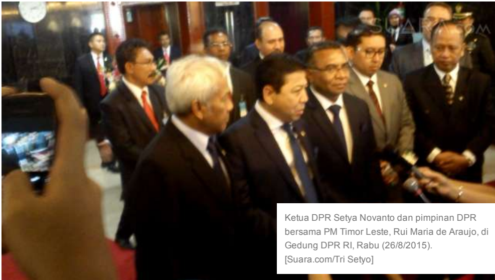
Ketua DPR Setya Novanto dan pimpinan DPR bersama PM Timor Leste, Rui Maria de Araujo, di Gedung DPR RI, Rabu (26/8/2015).