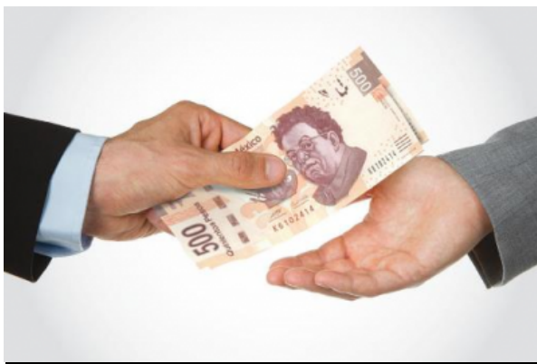
Respalda México que corrupción sea considerado crimen de lesa humanidad